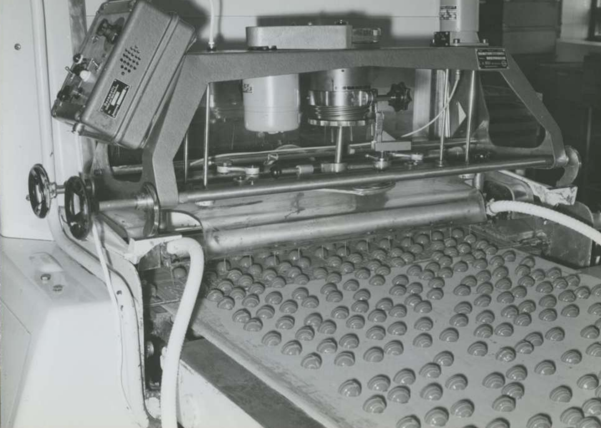
Leaf Oy: Suklaakonvehtien glaseerausta koneella (1960- tai 1970-luku)