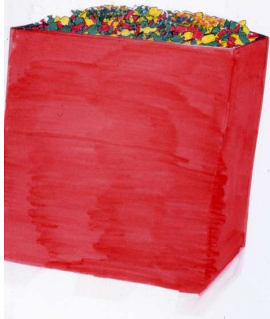
Leaf Oy: Myyntipakkausten luonnoksia/piirustuksia.