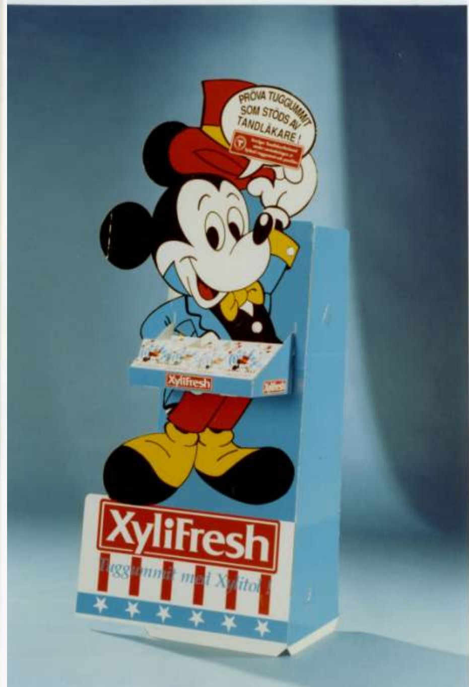
Leaf Oy: Purukumien myymäläpakkauksia.