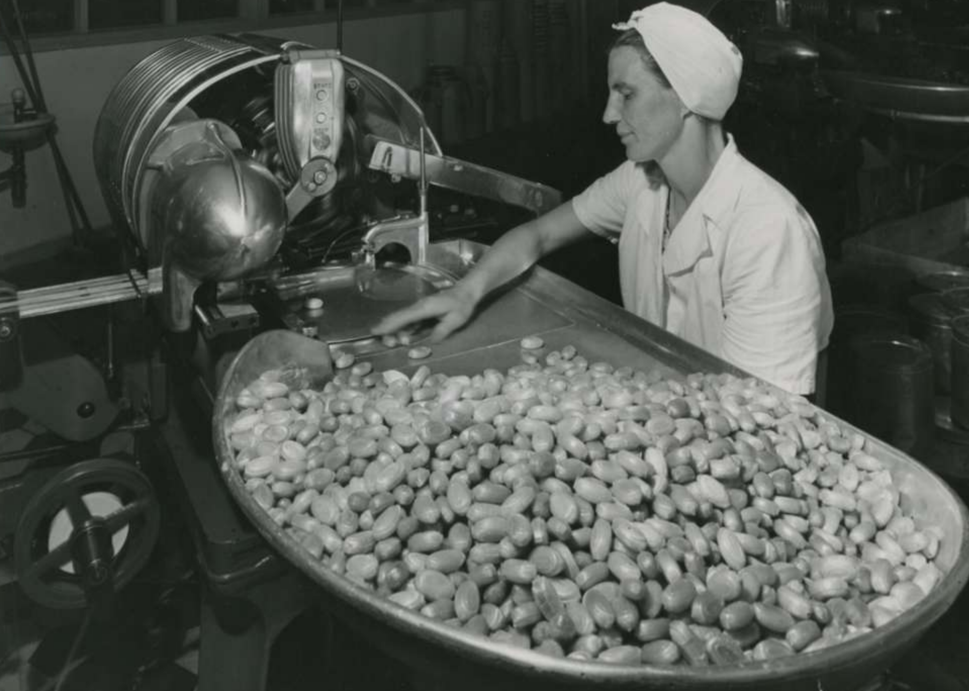
Leaf Oy: Työntekijä syöttää karamelleja käärimäkoneeseen. (1960- tai 1970-luku)